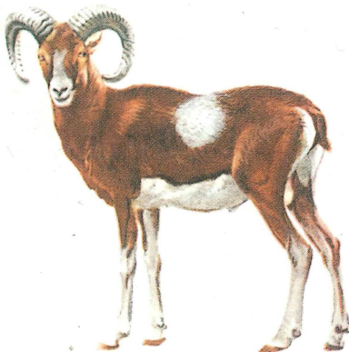
△ moeflon : de moeflonram wordt gekenmerkt door de zware, naar achter gebogen horens en voorts door lichtgekleurde delen: de snuit, het zadel en de spiegel.

moeflon (via Fr. mouflon v. Ital. mufflone ), de diersoort Ovis musimon (of – als men alle schapen van Eurazië en Noord-Amerika als één soort beschouwt – Ovis ammon musimon ) uit de *Geitachtigen. Dit wilde schaap uit de bergbossen van Corsica en Sardinië was tot in het midden van het Pleistoceen verspreid tot in Midden-Europa en leefde in de Romeinse tijd nog in Zuid-Europa in het wild. In de loop van de 19de eeuw werd de moeflon met succes uitgezet o.m. in de Alpen, het Middeneuropese middengebergte en de Balkan en komt daar, tot boven de boomgrens, in de vrije wildbaan voor. In Nederland bevindt zich sinds 1921 een roedel op De Hoge Veluwe en sinds 1958 een kleiner in de Koninklijke Houtvesterijen van Het Loo, waar de dieren goed gedijen.